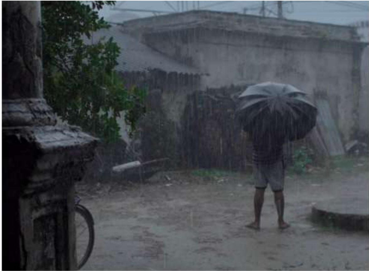
Una imagen de On Either Sides of the Pond . (Parth Saurav). India. Sección Oficial. XXII ImagineIndia

En Sección Oficial a concurso, se seleccionaron un total de 14 largometrajes de cinematografías muy diversas, películas que llegan desde Nepal, Indonesia, Corea del Sur, por supuesto India o Azerbaiyán. Podéis consultar el listado completo aquí .