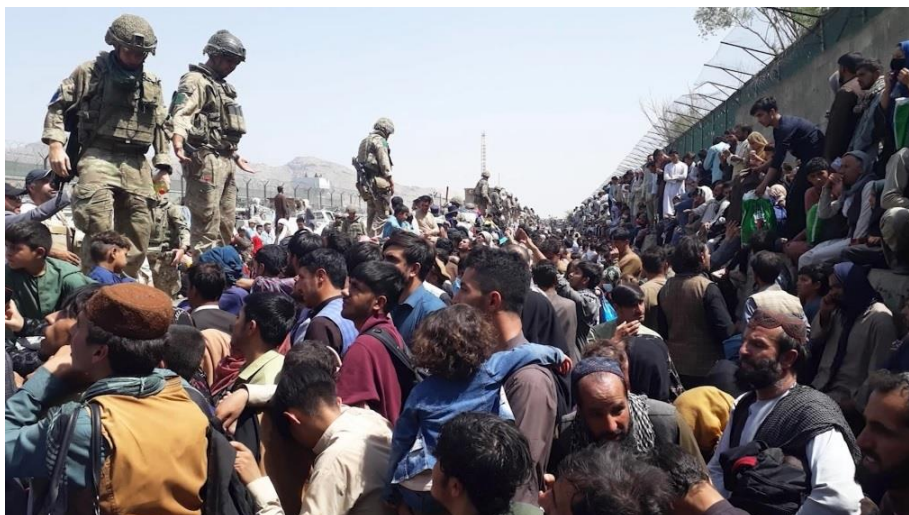
Fotograma de la película The List (Irán). Sección Save Afghanistan. XXIII ImagineIndia

Los cortometrajes españoles, tienen su propia sección en ImagineIndia y el ganador obtendrá el Premio RC al Mejor Cortometraje español.